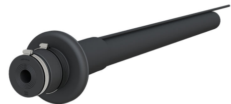
Bilden kan avvika från den valda produkten

För tillförlitlig tätning av alla elektriska ledningar och telekommunikationsledningar utan extra krympning via en tätningsmanschett.