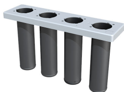
Tesnilni vložek za sestavni del gradnje v začetni fazi