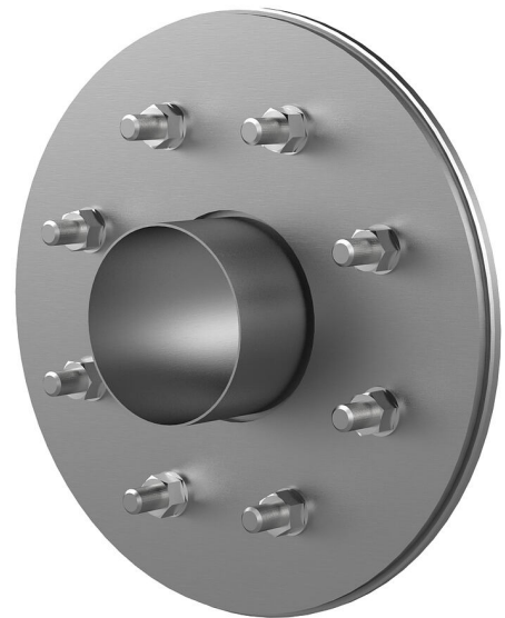
Slika se lahko razlikuje od izbranega izdelka

Za privijanje z vijaki in vložki na cevne uvodnice, izvrtine in preboje.