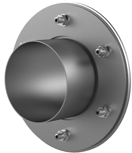
Slika se lahko razlikuje od izbranega izdelka

Za vbetoniranje ali zalivanje z malto v stenah, stropih ali tleh.