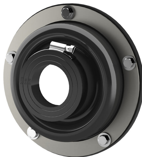
Slika se lahko razlikuje od izbranega izdelka

Za privijanje z vijaki in vložki na izvrtine, preboje ali cevne uvodnice na stenah ali privijanje pred vdolbinami v pločevinastih ohišjih. Odvisno od sistema je mogoče manšeto strokovno povezati z obstoječo zatesnitvijo kleti brez obsežnega naknadnega dela. Z istim delom se hkrati izvede zatesnitev vanj vstavljene cevi za medij.