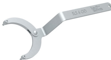
Ključ s čelnima zatičema