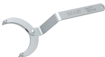
Ključ s čelnima zatičema