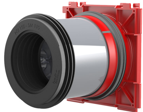
Slika se lahko razlikuje od izbranega izdelka

Za enostransko priključitev sistemskih zatesnitev za kable (znotraj) in za priključitev kabljskih zaščitnih cevi (zunaj).