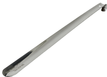
Montažna pločevina za protipožarno blazino