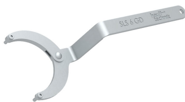
Ključ s čelnima zatičema