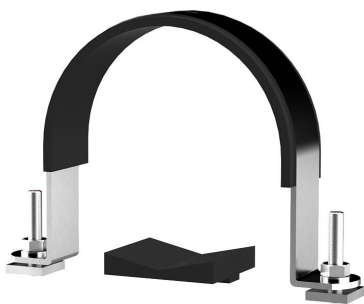
Lok za pritrdjevanje