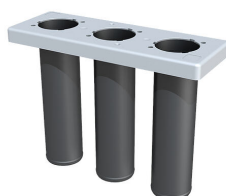
Tesnilni vložek za sestavni del gradnje v začetni fazi