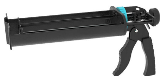
Pistolet na wkłady