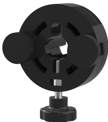
Narzędzie szybkiego montażu