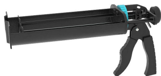
Pistolet na wkłady