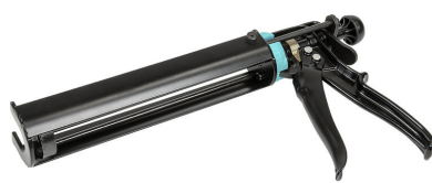
Pistolet na wkłady