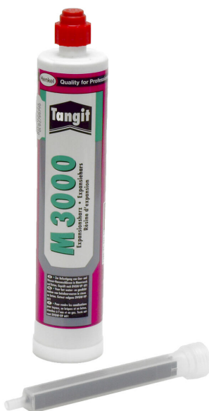
Żywica 2-komponentowa M3000