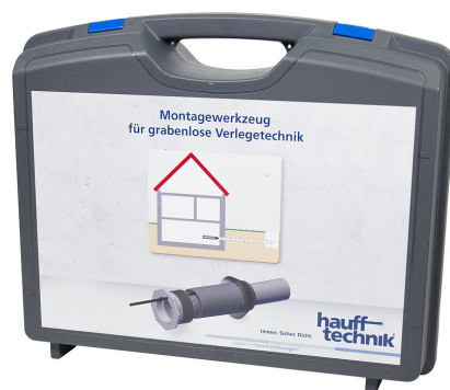
Walizka montażowa MIS NoDig