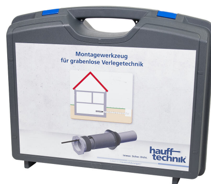
Walizka montażowa MIS NoDig