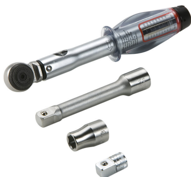
Zestaw narzędzi do montażu pokryw KES-M