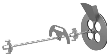
Urządzenie do wypełniania