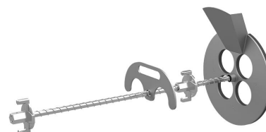
Urządzenie do wypełniania