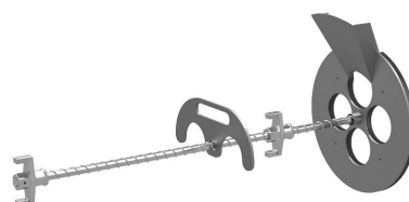
Urządzenie do wypełniania