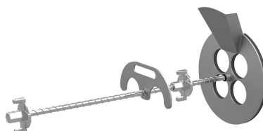
Urządzenie do wypełniania