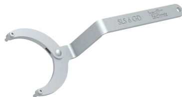
Klucz do pokryw