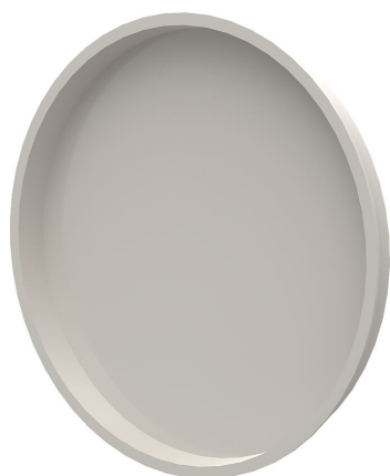
Dekiel zabezpieczający z PE