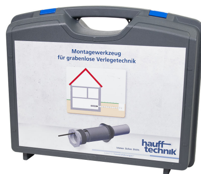
Montagekoffer MIS NoDig