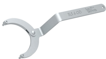
Chiave a bussola snodabile