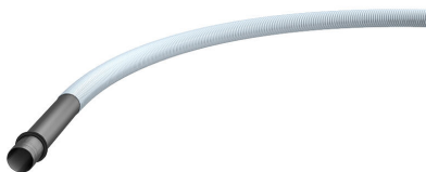
Sistema di tubi a spirale