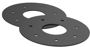
Inserti in gomma