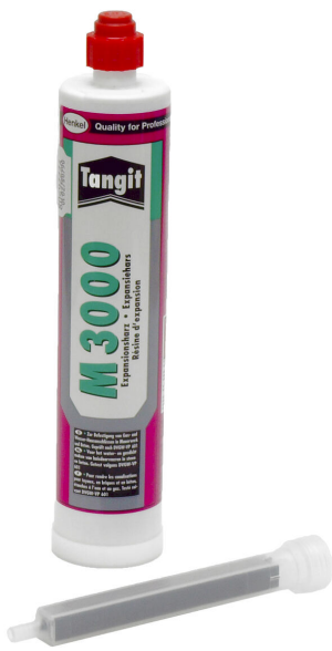
Resina bicomponente M3000