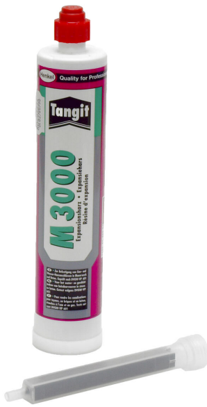
Resina bicomponente M3000