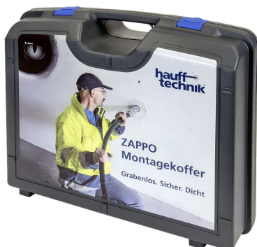
Valigetta di montaggio ZAPPO