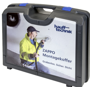
Valigetta di montaggio ZAPPO