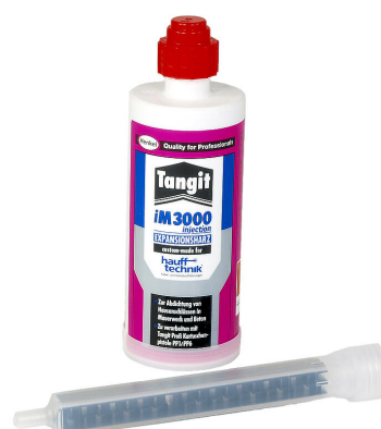
Resina bicomponente iM3000