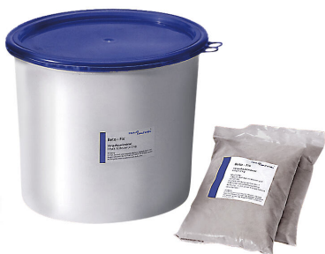
Malta di riempimento Hauff-Beto-Fix