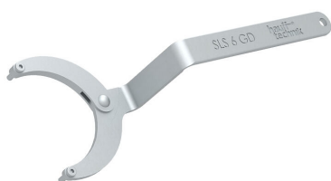
Chiave a bussola snodabile