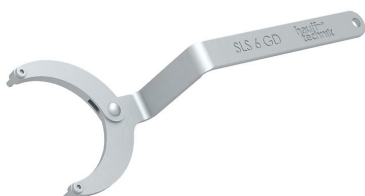
Chiave a bussola snodabile