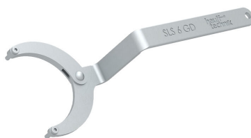
Chiave a bussola snodabile