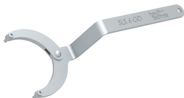
Chiave a bussola snodabile