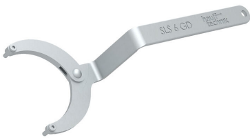
Chiave a bussola snodabile