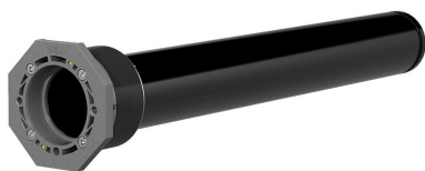
Variante di base con guarnizione interna