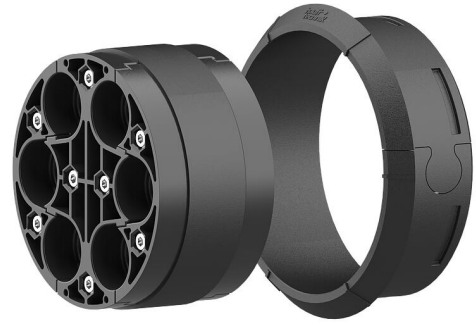
A kép eltérhet a kiválasztott terméktől

Tömítőcsomagban és HSI150 műanyag peremben történő használatra. Osztott kivitel újonnan telepítendő vagy már telepített kábelek tömítéséhez.