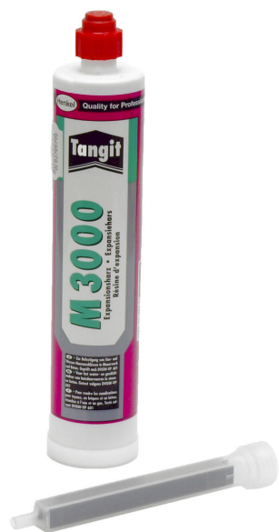
M3000 2 komponensű gyanta