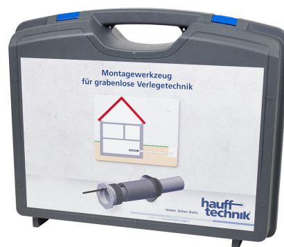
MIS NoDig szerelőköffer