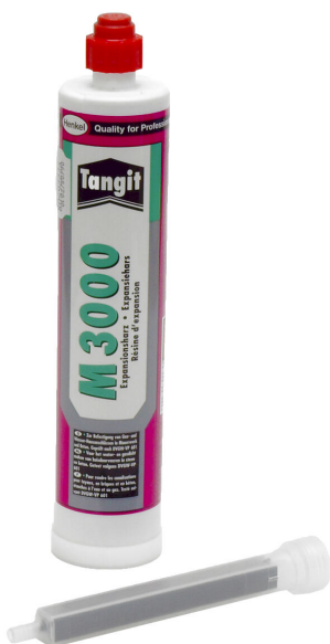
M3000 2 komponensű gyanta