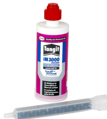
iM3000 2 komponensű gyanta