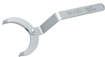
Zglobni ključ za matice s dvije rupe