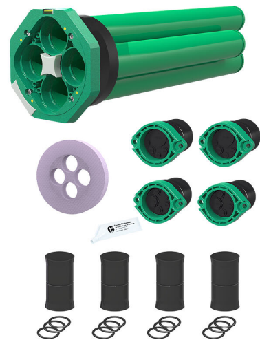
Slika može odstupati od odabranog proizvoda

Za raspodjelu strujnih i komunikacijskih vodova od zgrade do zemljišta.