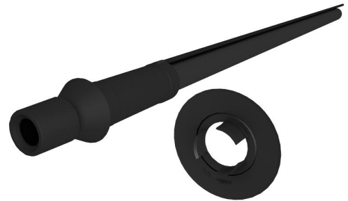
Slika može odstupati od odabranog proizvoda

Prikladno za kosi uvod kroz zid ili podnu ploču.