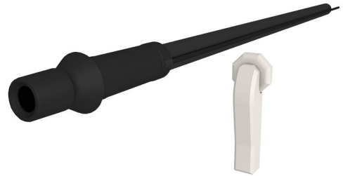
Slika može odstupati od odabranog proizvoda

Prikladno za kosi uvod kroz zid ili podnu ploču.