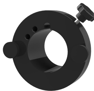
Naprava za brzo pritezanje