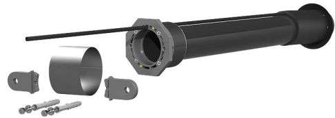
Slika može odstupati od odabranog proizvoda

Za pouzdano brtvljenje vodova za vodu za piće, struju ili telekomunikacije. Za to se iz podruma zgrade pomoću zemljane bušilice probija put za praznu cijev do ruba zemljišta.