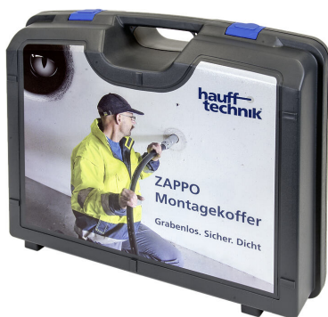
Kutija za montažu ZAPPO